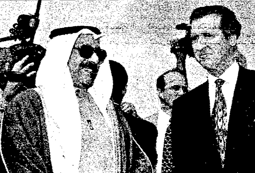
وزير الدفاع الامريكي وليام كوهين مع نظيره الكويتي صباح السالم الصباح في الكويت امس

الكويت - اف ب - اعلن وزير الدفاع الامريكي وليام كوهين امس الاثنين في الكويت ان الرئيس العراقي صدام حسين يسك يفتاح حل الازمة مع الامم المتحدة الذي يمكن ان يقي العراق من عصف عسكري امريكي. وقال كوهين اثناء مؤتمر صحافي ان «صدام حسين يسك مطاوع الحل الدبلوماسي لهذه الازمة، وهو يمكن ان يخلصنا من النف باحترامه لقرارات مجلس الامن، مؤكدا ان «الامر بسيط جدا بالنسبة اليه». واعن كوهين ان الولايات المتحدة «تأمل في التوصل الى حل دبلوماسي لكن صيرنا ليس ابديا وهو يفتد». لكنه رفض تحديد ميلة للعراق. واضاف «لدينا الامم المتحدة التي تتوسط للجهود الخيجية على الخط الامريكية لتوجيه ضربة الى العراق في حال فشل الجهود الدبلوماسية». وقال كوهين ان حل خارج دبلوماسيا يجب ان يكون متفقا مع قرارات الامم المتحدة التي تنص على دخول قوة مشتركة من دول ارباع العالم للتحقق من الامم المتحدة حول حق التفتيش عن الاسلحة المتطورة في العراق في حال فشل الجهود الدبلوماسية. وقال كوهين ان حل خارج دبلوماسيا يجب ان يكون متفقا مع قرارات الامم المتحدة التي تنص على دخول قوة مشتركة من دول ارباع العالم للتحقق من الامم المتحدة حول حق التفتيش عن الاسلحة المتطورة في العراق في حال فشل الجهود الدبلوماسية. وقال كوهين ان حل خارج دبلوماسيا يجب ان يكون متفقا مع قرارات الامم المتحدة التي تنص على دخول قوة مشتركة من دول ارباع العالم للتحقق من الامم المتحدة حول حق التفتيش عن الاسلحة المتطورة في العراق في حال فشل الجهود الدبلوماسية.